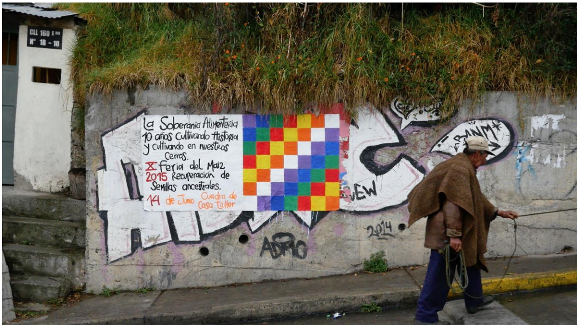
Feria del maíz Cerro Norte 2015