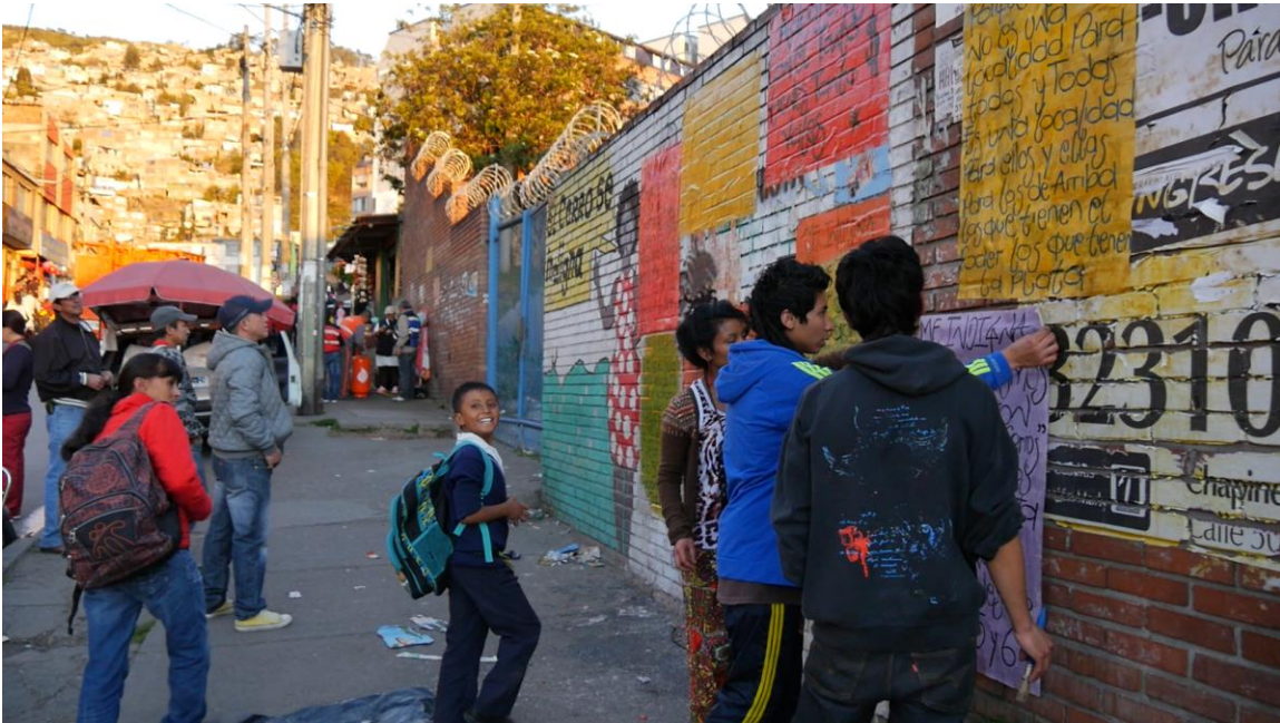
Jóvenes de Cerro Norte y Villa Nidia preparando la publicidad para las jornadas de indignación campesina y popular. Agosto 2015

MOVIMIENTO REGIONAL COLOMBIA POR LA TIERRA