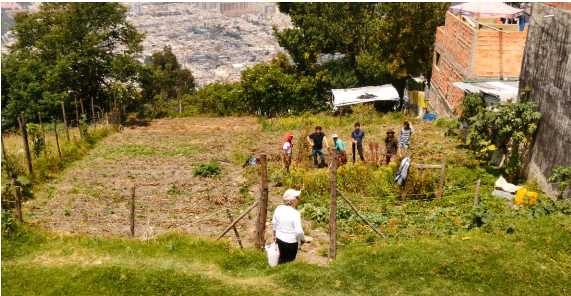
Doña Carmen y un grupo de jóvenes en tareas de mantenimiento de uno de los lotes comunitarios.