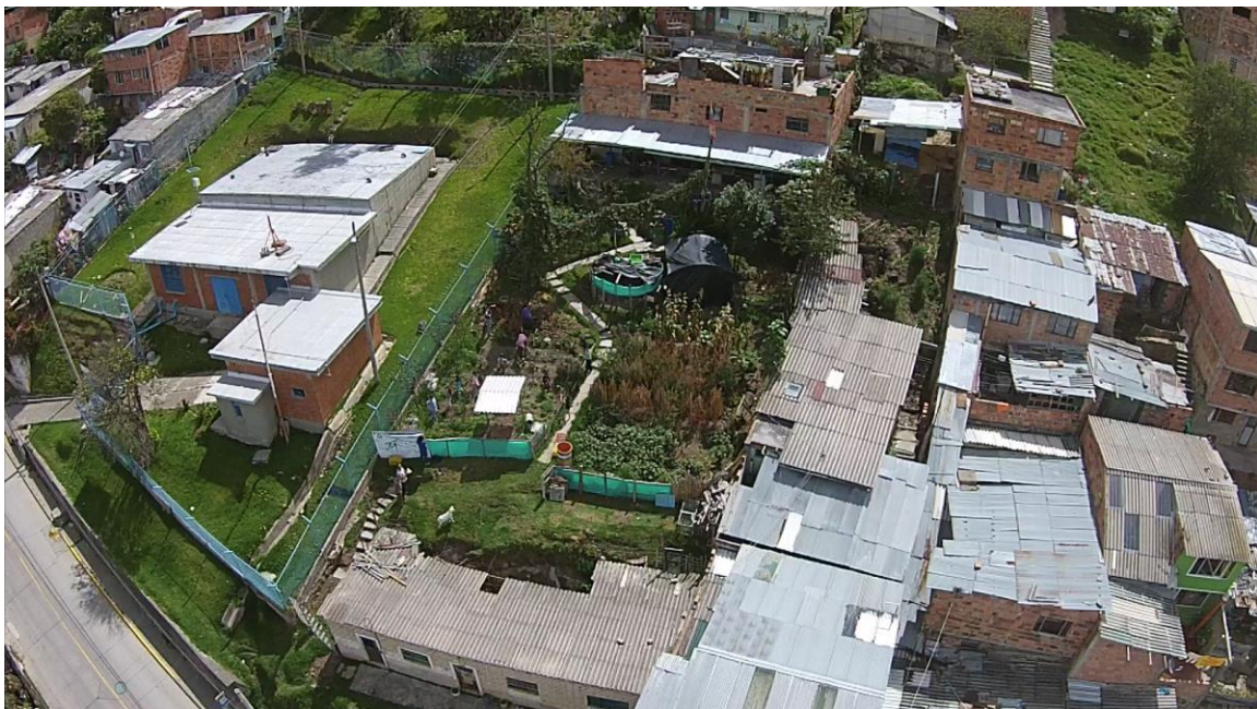
Granja Agroecológica Experimental Hugo Fernández