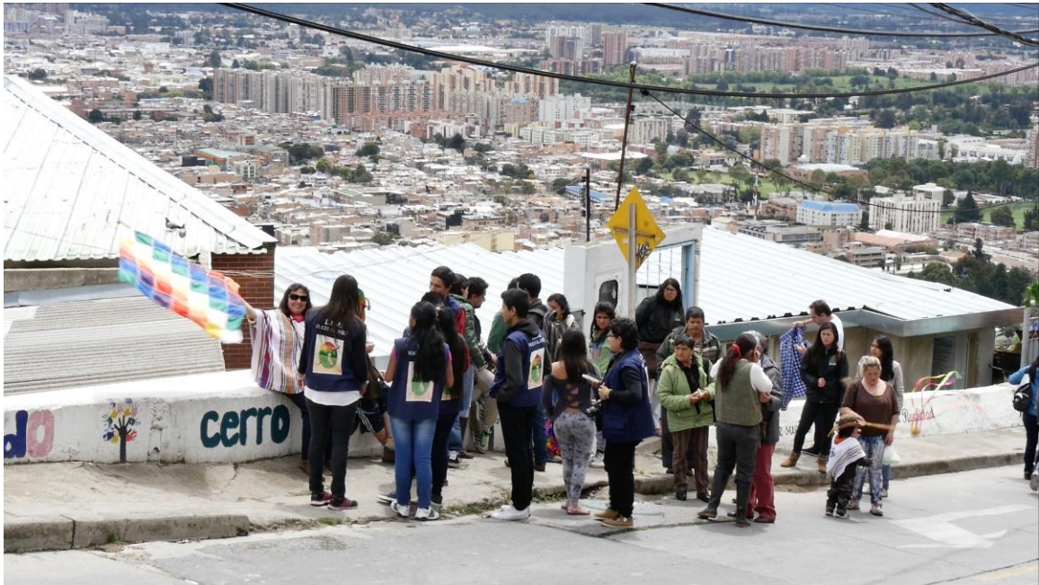
Vista de Bogotá desde Cerro Norte

MOVIMIENTO REGIONAL COLOMBIA POR LA TIERRA