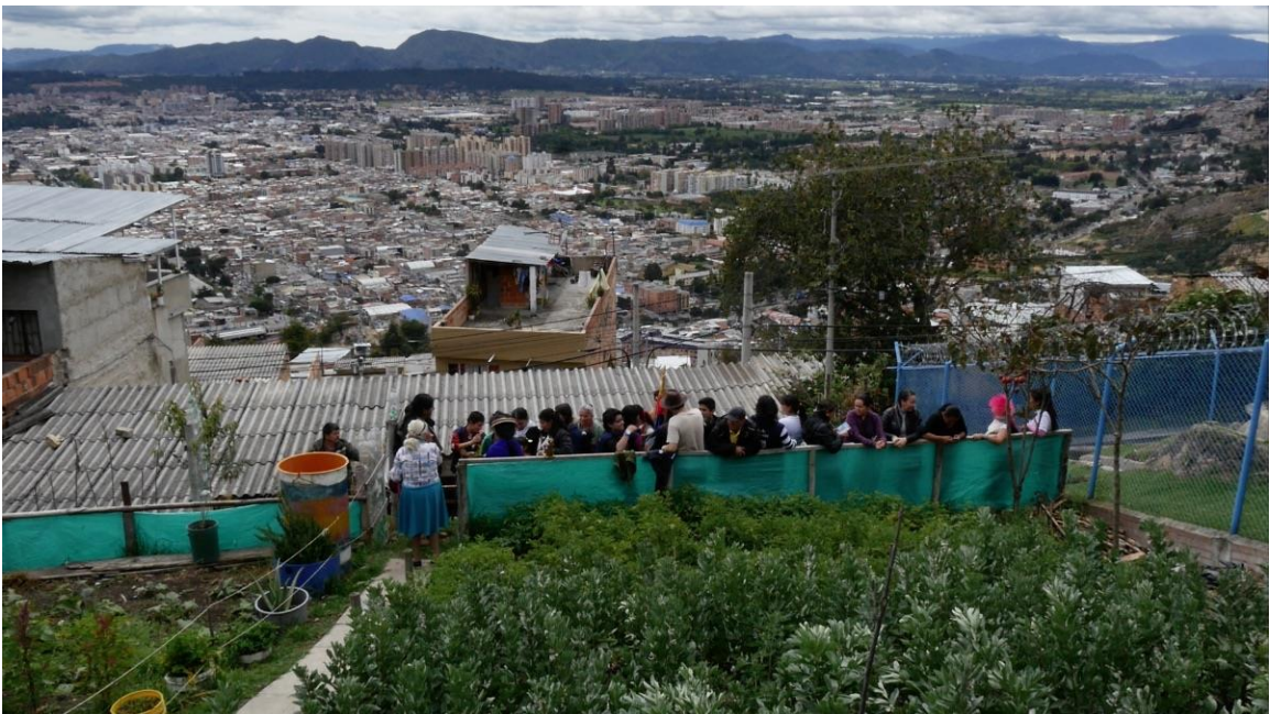
Minga de trabajo en la granja agroecológica. A jornada asisten niños, jóvenes y abuelos.