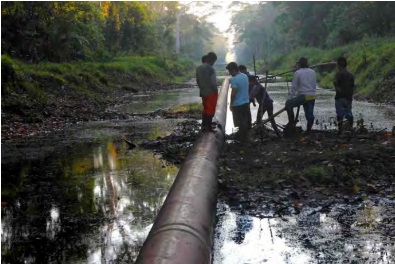
Contaminación petrolera en el Perú. 2016