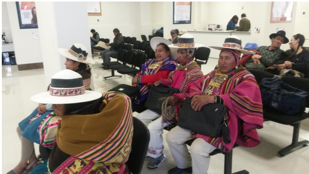
Autoridades de diferentes naciones en oficinas del SEGIP iniciando su trámite de identificación para incluir su identidad cultural.