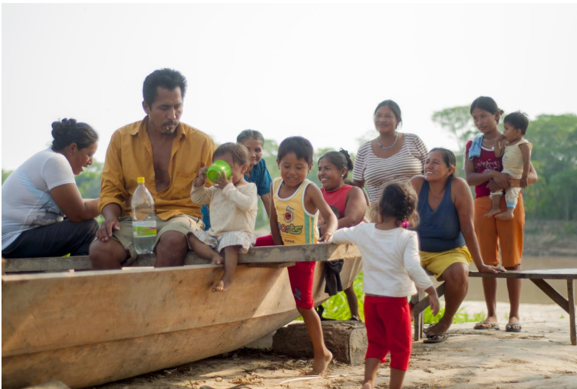
Las familias y el transporte en el TIPNIS, porque el camino es el río