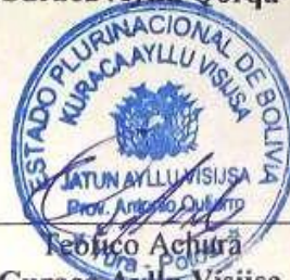
Febrico Achura Curaca Ayllu Visijsa