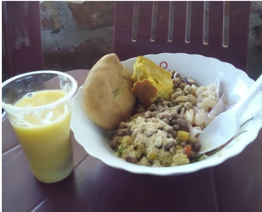
Chicha de maíz, cumanda, cebolla, septiembre 2016