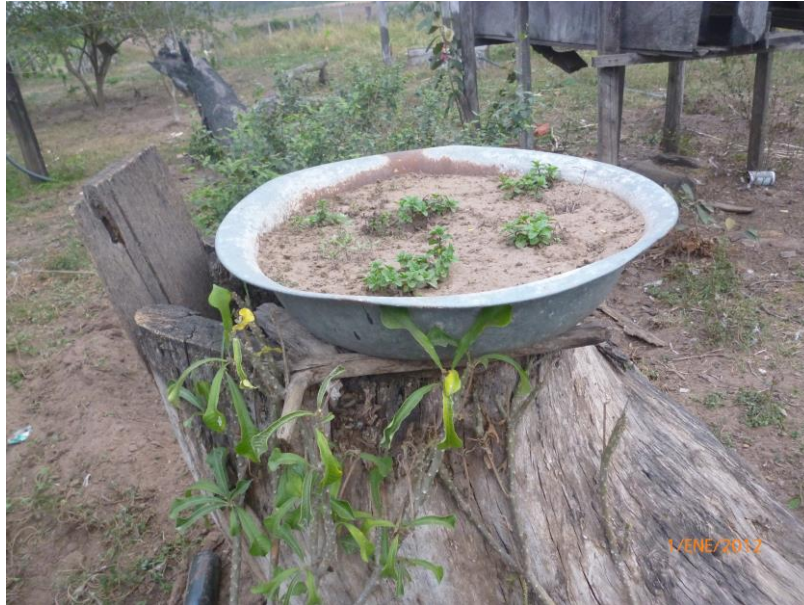
Almaciguero y zapallos en casa de doña Bernardina Ardiles