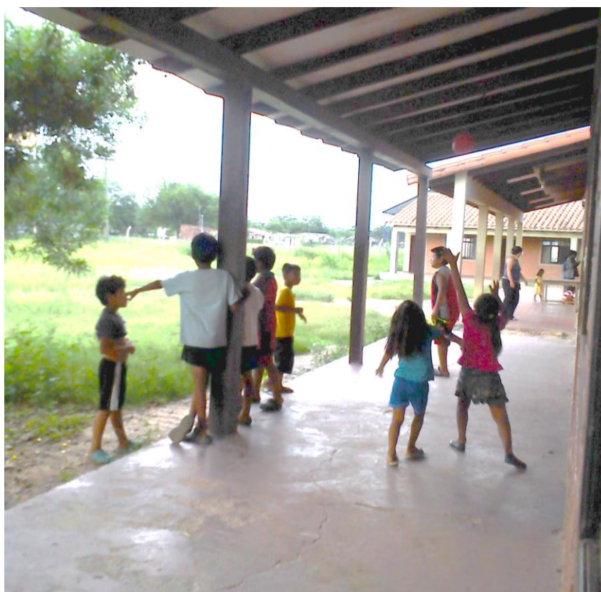
Escuela de Yateirenda