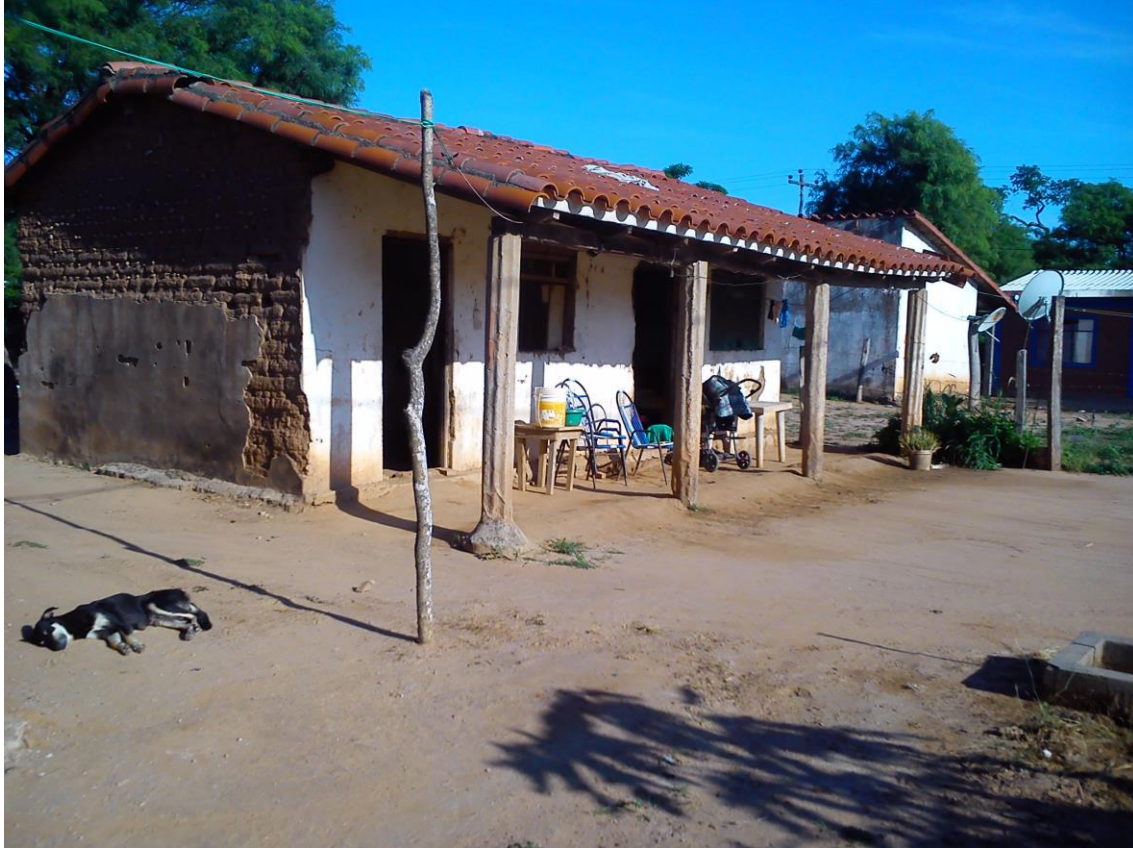
Casa de Hilda Gavino

“Pensé que ahí se acababa todo. Mis hijos (y yo) nos asustamos mucho. Todo se movía y fue largo, largo.” (Isabel Chumira, julio 2016)